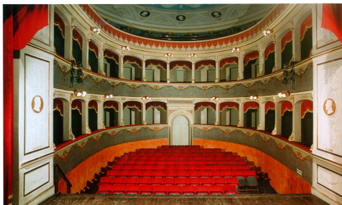
Interno Teatro "Erice Petrella" - Anno 1870